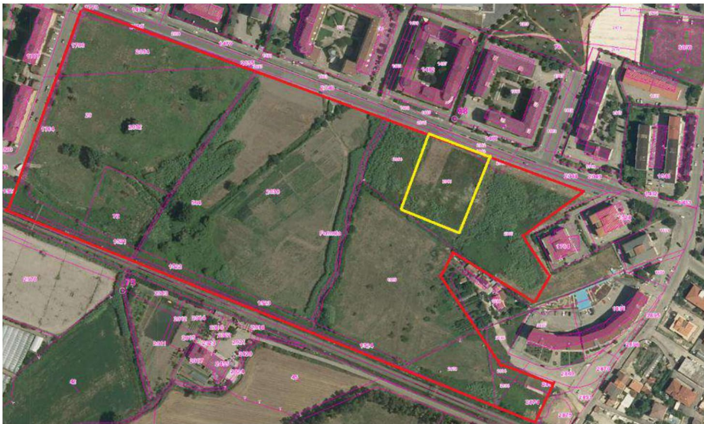
Area Sorgiva in rosso, area caserma in giallo