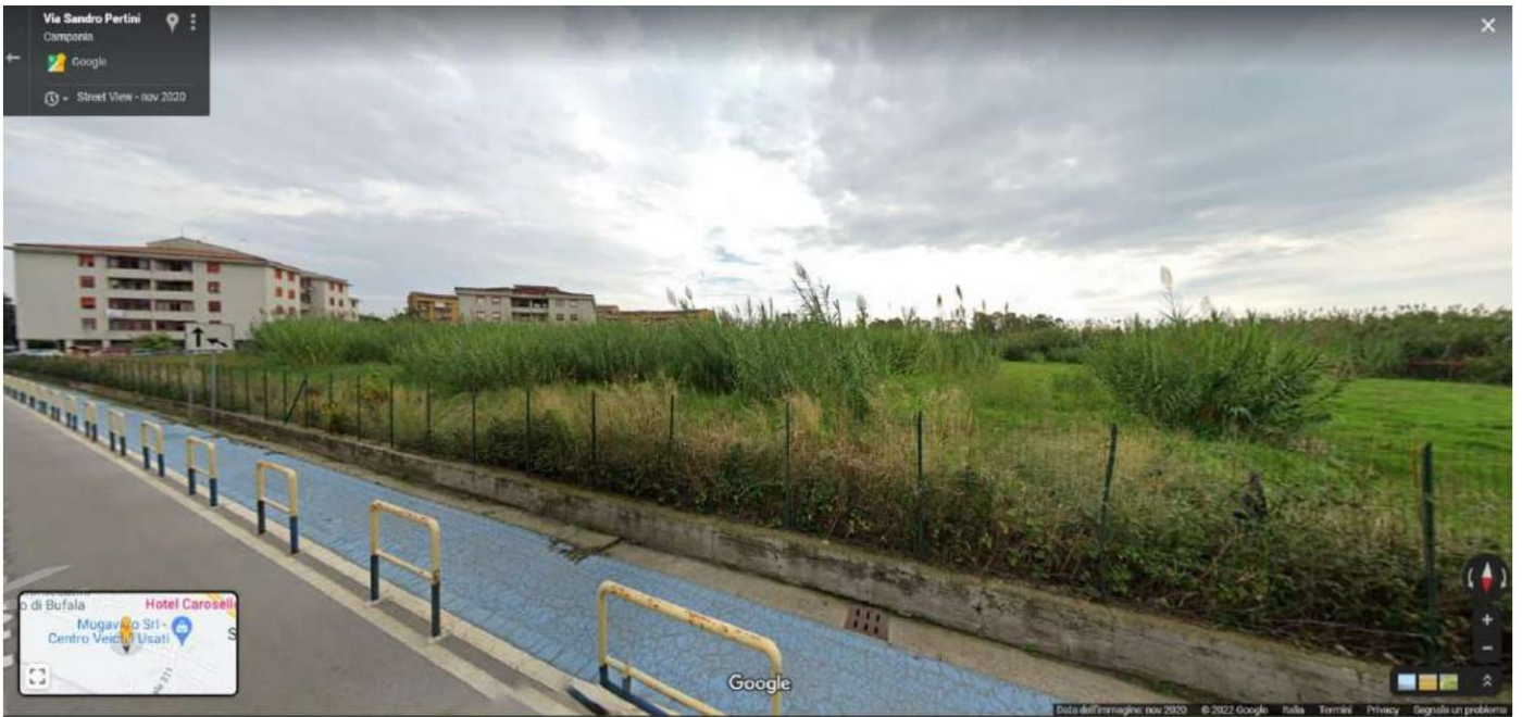
Foto dell'area identificata per la caserma con i canneti